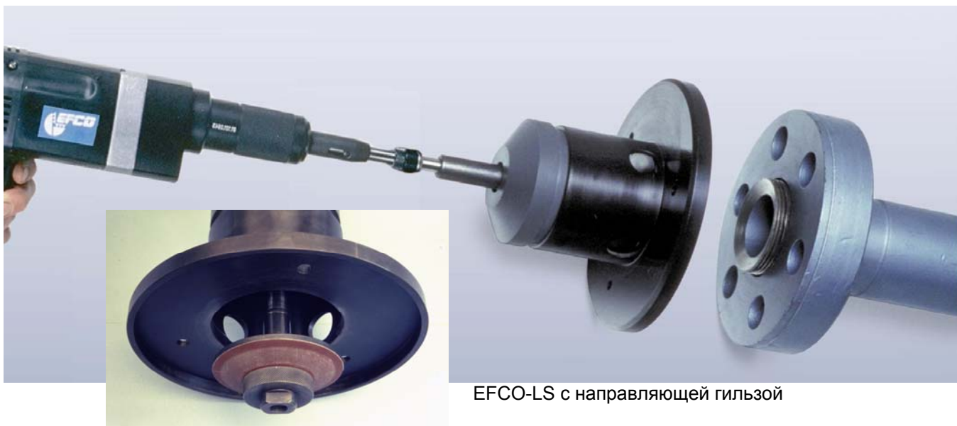
EFCO-LS с направляющей гильзой

Благодаря применению специальных точных направляющих гильз возможна абсолютно центрическая обработка уплотнительной поверхности. Для малых номинальных диаметров используются направляющие гильзы. При обработке труб больших номинальных диаметров применение специального зажимного патрона обеспечивает абсолютно точное ведение шлифовального инструмента.